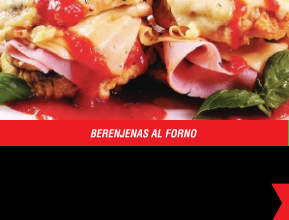
BERENJENAS AL FORNO